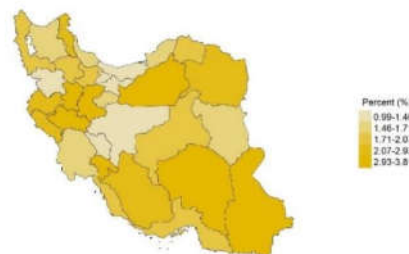
درصد کودکان ۱ تا ۱۴ ساله که یکی از والدینشان فوت شده است (۱۳۹۴)