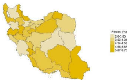
درصد کودکان ۱ تا ۱۴ ساله که با یکی از والدینشان زندگی نمی‌کنند (۱۳۹۴)

خانواده پایه‌گذار و تعیین‌کننده سرنوشت کودکان در آینده است. از دست دادن والدین، چه به صورت یتیم‌شدن و چه به صورت طلاق باعث عوامل ناسازگاری در کودکان و نوجوانان می‌شود. مرگ یا طلاق و فقدان پدر یا مادر باعث می‌شود کودک از لحاظ عاطفی دچار کمبود شده و از نظر اقتصادی و عاطفی با محدودیت روبه‌رو شود. مشکلات روانی و جسمانی، تربیتی، احساس گناه و سردرگمی، اختلال در هویت و احتمال گرایش به بزهکاری را می‌توان از جمله آثار مخرب و زیانبار معنوی و مادی طلاق روی فرزندان برشمرد. مطابق مطالعه شاخص‌های چندگانه سلامت و جمعیت در سال ۱۳۹۴، مشخص شد ۳/۴ درصد از کودکان یک تا ۱۴ ساله ایرانی، یکی از والدینشان را در زندگی ندارند و ۲ درصد این کودکان یکی از والدینشان فوت شده است. در فقیرترین قشر درآمدی، درصد نبود یا فوت والدین، بیشتر از بقیه اقشار درآمدی است. فوت پدر درصد